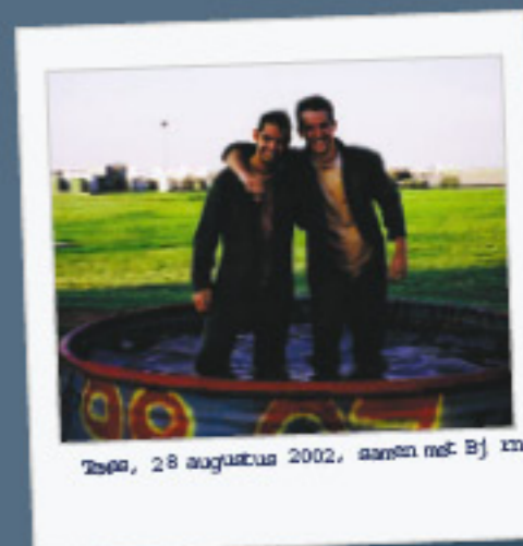
Zes, 28 augustus 2002, samen met Bj xx

Voordat je wordt toegelaten tot de vliegeropleiding, ga je eerst door een uitgebreid selectie- en keuringsprogramma. Deze onderzoeken nemen bij elkaar een aantal maanden in beslag. Je wordt onder meer psychologisch en medisch onderzocht. Verder doe je testen op de vluchtsimulator en maak je een aantal testvluchten onder begeleiding van een instructeur.